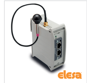
ELESA original design UC-RF